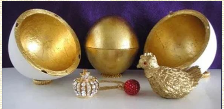
Il primo esemplare delle uova imperiali Fabergé 1885 (foto 1)

S iamo a Pasqua, la seconda vissuta in mezzo a una pandemia che sembra non dover finire, e già il profumo frizzante della primavera ci porta almeno a pensare che tipo di uovo compriremo e la curiosità si accende per ciò che vi troveremo all'interno. Ma che cosa lega la Pasqua all'uovo e l'uovo alla sorpresa? Ebbene l'uovo fin dall'antichità ha rappresentato il simbolo della rinascita nelle feste pagane di primavera, esso era il segno del risveglio alla vita del mondo vegetale e animale. Presso gli indiani l'uovo era il simbolo della totalità del mondo, cielo e terra erano paragonati alle due metà di un uovo. Anche presso gli egizi il segno ANKH, che passò nella tradizione cristiana come croce ansata o manicata, ricorda l'immagine dell'uovo del mondo e in Grecia le statue di Dioniso, rinvenute nelle tombe in Beozia, avevano un uovo in mano, segno del ritorno alla vita. Per i cristiani l'uovo è simbolo di Resurrezione, poiché Cristo uscì dal sepolcro il mattino di Pasqua, come il pulcino dall'uovo in cui si trova sepolto. In Russia i pittori di icone non usavano l'olio nei loro colori, ma il rosso d'uovo perché era un'allusione alla Pasqua e alla Resurrezione di Cristo a una nuova vita trasfigurata. L'usanza cristiana delle uova di Pasqua iniziò in Mesopotamia quando i primi cristiani iniziarono a macchiare le uova con una colorazione rossa in ricordo del sangue di Cristo versato sulla Croce. Nel Medioevo in Germania nacque l'usanza di regalare uova bollite, decorate con