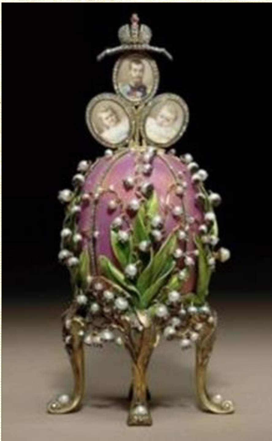
Uovo Gigli della valle Fabergé, 1898 - (foto 3)