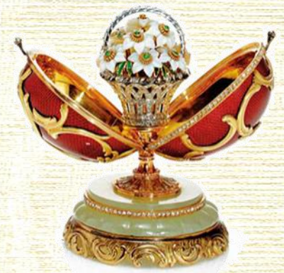
Uovo del cesto di fiori Fabergé, 1901 - (foto 2)

La Zarina felice per il dono nominò Fabergé gioielliere della corte imperiale e fu incaricato di fare ogni anno un regalo di Pasqua con la condizione che ogni uovo doveva essere unico e contenere una sorpresa. A partire dal 1895 quando morì Alessandro III e salì al trono il figlio Nicola II vennero prodotte due uova ogni anno, uno per la nuova Zarina Alessandra Romanova e uno per l'imperatrice madre. (foto 2)