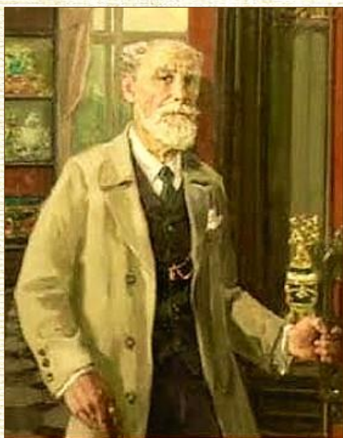
Peter Carl Fabergé

Solo tra il 1904 e il 1905 non fu realizzato alcun uovo a causa delle restrizioni imposte dalla guerra russo-cinese. La preparazione delle uova richiedeva un anno intero di lavoro e una squadra di artigiani per montarle. Nel 1918 la fabbrica orafa fu statalizzata e Fabergé non si riprese più dallo choc della Rivoluzione del 1917. (foto 3) Sull'esempio degli zar anche il nobile russo Alexander Kelch commissionò a Fabergé sette uova gioiello di Pasqua, una per ogni anno, dal 1898 al 1904 per donarle alla moglie Barbara, le uova della collezione Kelch erano più grandi e più sontuose di quelle imperiali, ma nel 1920 Barbara le vendette e oggi si trovano in musei o in collezioni private. Dunque a ciascuno il suo uovo, di zucchero, di cioccolato, di ceramica o di porcellana oppure perché no, viziamoci con le preziose uova in stile Fabergé, comunque sia il nostro uovo rimane fin dai tempi remoti l'immagine della rinascita dopo un lungo e doloroso inverno e un segno di speranza per tutti.